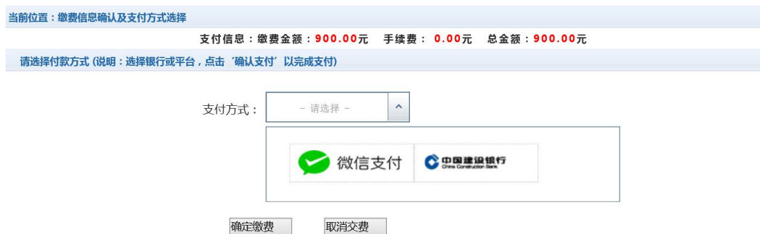
图 3.4-4 缴费方式选择