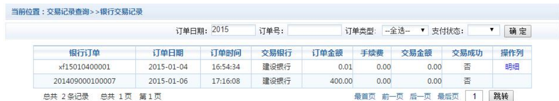
图 3.6-1 交易记录查询

点击导航栏的“交易记录查询”按钮，可以查询具体的银行交易记录。如图 3.6-1 所示。