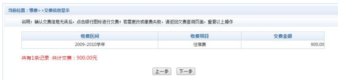
图 3.4-3 缴费方式选择