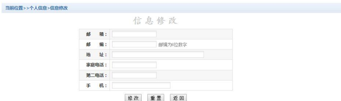
图 3.2.1-1 个人信息修改

点击个人信息界面的个人信息修改，显示 3.2.1-1 所示的个人信息维护界面。在相应的输入框，输入需要修改的个人信息，点击“修改按钮”完成个人信息维护。未保存前，点击“重置”按钮，还原个人信息。