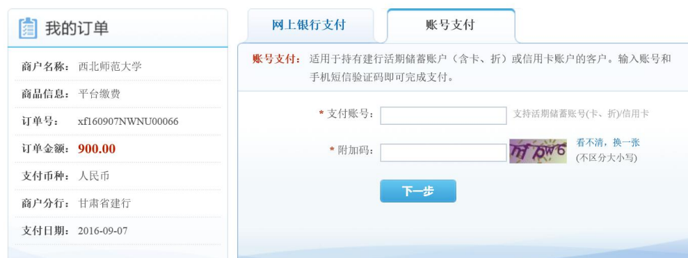
图 3.4-12 建行账号支付

如果持有建设银行储蓄卡或信用卡，请点击“中国建设银行”，进入如图 3.4-12 所示建行账号支付界面。